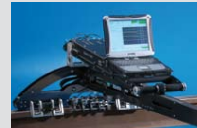
Servicesysteme für den Einsatz vor Ort