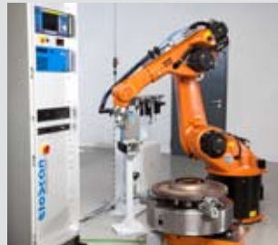
Sonderlösungen angepasst an Ihre individuellen Aufgabenstellungen